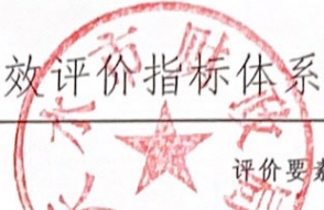
单位整体支出绩效评价指标体系评分表